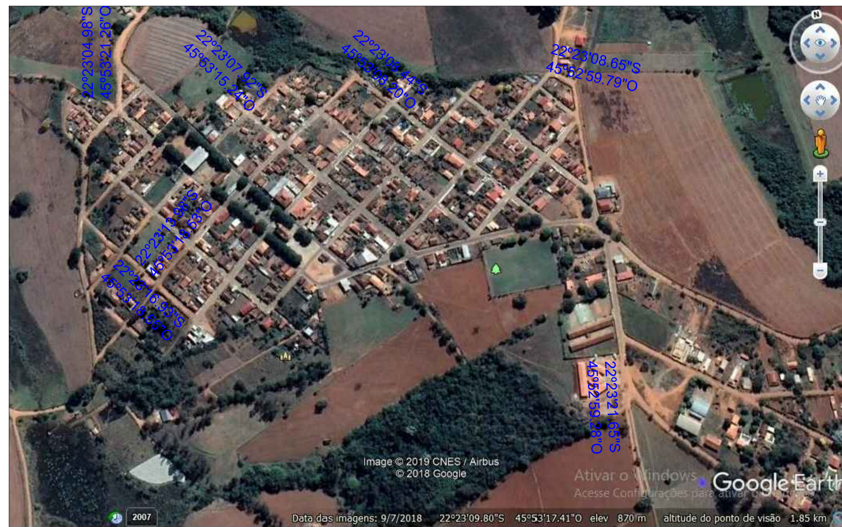
LOCALIZAÇÃO - COORDENADAS SEM ESCALA